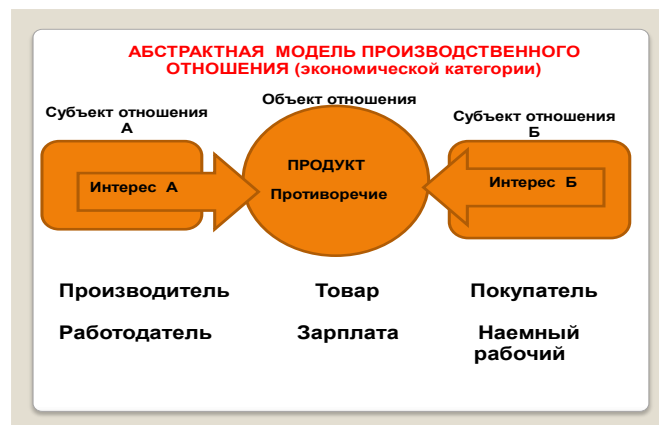
Рис. 1. Абстрактная модель производственного отношения

В научной литературе любая экономическая категория представляет собой теоретическое (абстрактное) выражение реально существующих производственных отношений. С помощью компьютерной графики мы создаем модель производственного отношения и наглядно раскрываем содержание любой экономической категории. На рисунке 1 представлена в общей форме абстрактная модель производственного отношения, на основе которой мы объясняем содержание любой экономической категории.