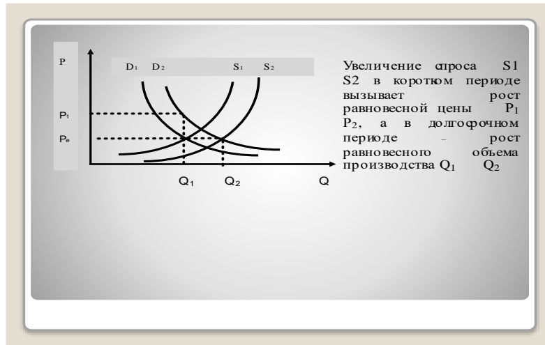
Рис. 2. Влияние дохода на рыночную цену товара

Объясняется это тем, что в коротком периоде производители не могут мгновенно отреагировать на увеличение спроса, обусловленного увеличением доходов населения. В результате возникает дисбаланс между спросом и предложением в пользу спроса, что и приводит к росту цен на товары. В долгосрочном периоде производители товаров постепенно увеличивают объемы производства, что приводит к снижению рыночной цены товара и установлению баланса между спросом и предложением, но уже при новых условиях, старых ценах и новом большем объеме производства.