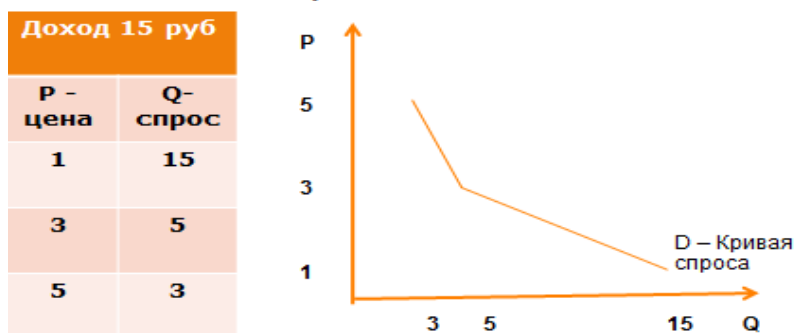
Рис. 7. Причинно-следственные связи между доходом, ценой товара и спросом

Также компьютерная графика может использоваться как средство поддержки интереса обучающихся к