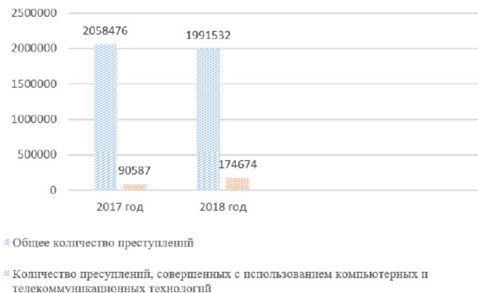
Рис. 1. Сведения о количестве зарегистрированных преступлений в Российской Федерации за 2017–2018 гг.

Рост преступлений, связанных с использованием компьютерных и телекоммуникационных технологий, подтверждается и статистическими показателями о количестве зарегистрированных преступлений, совершенных в киберпространстве (см. рис. 1).